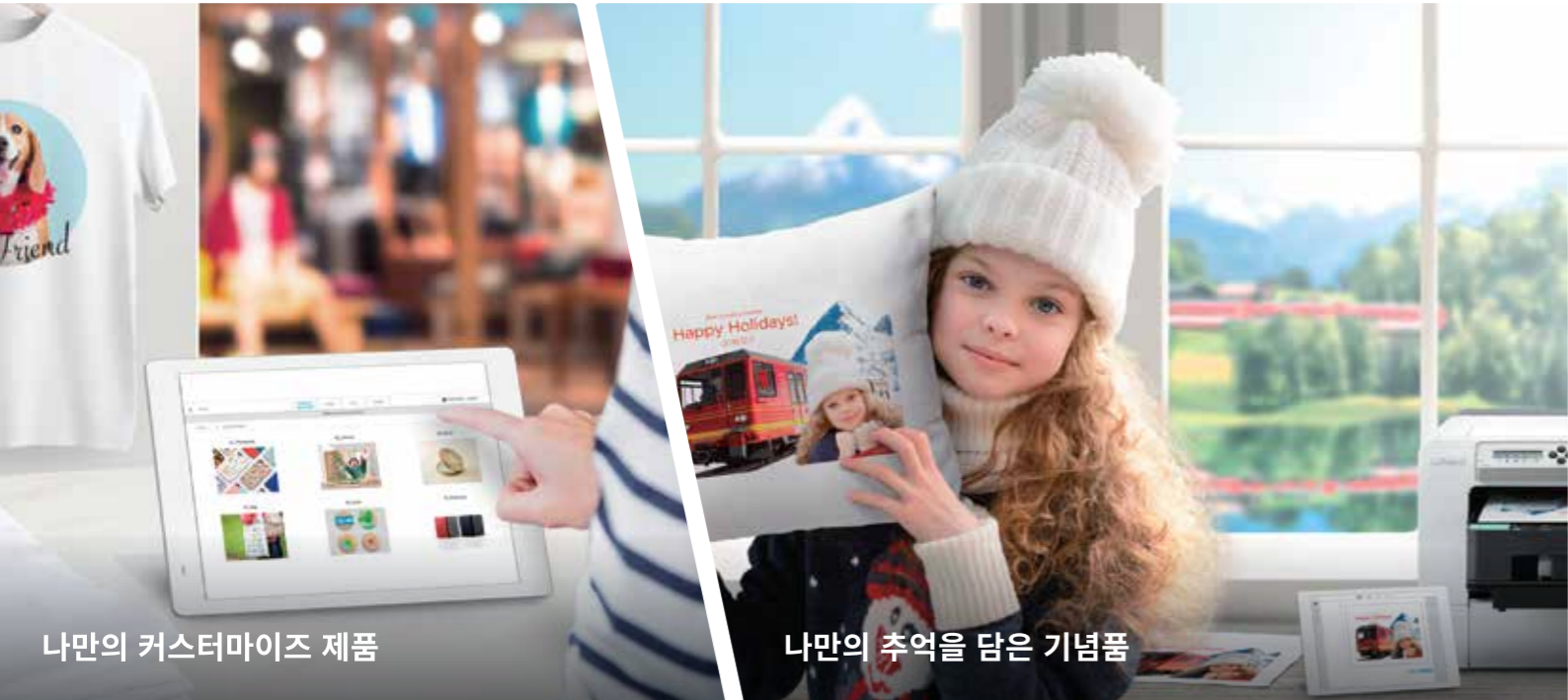
나만의 커스터마이징 제품