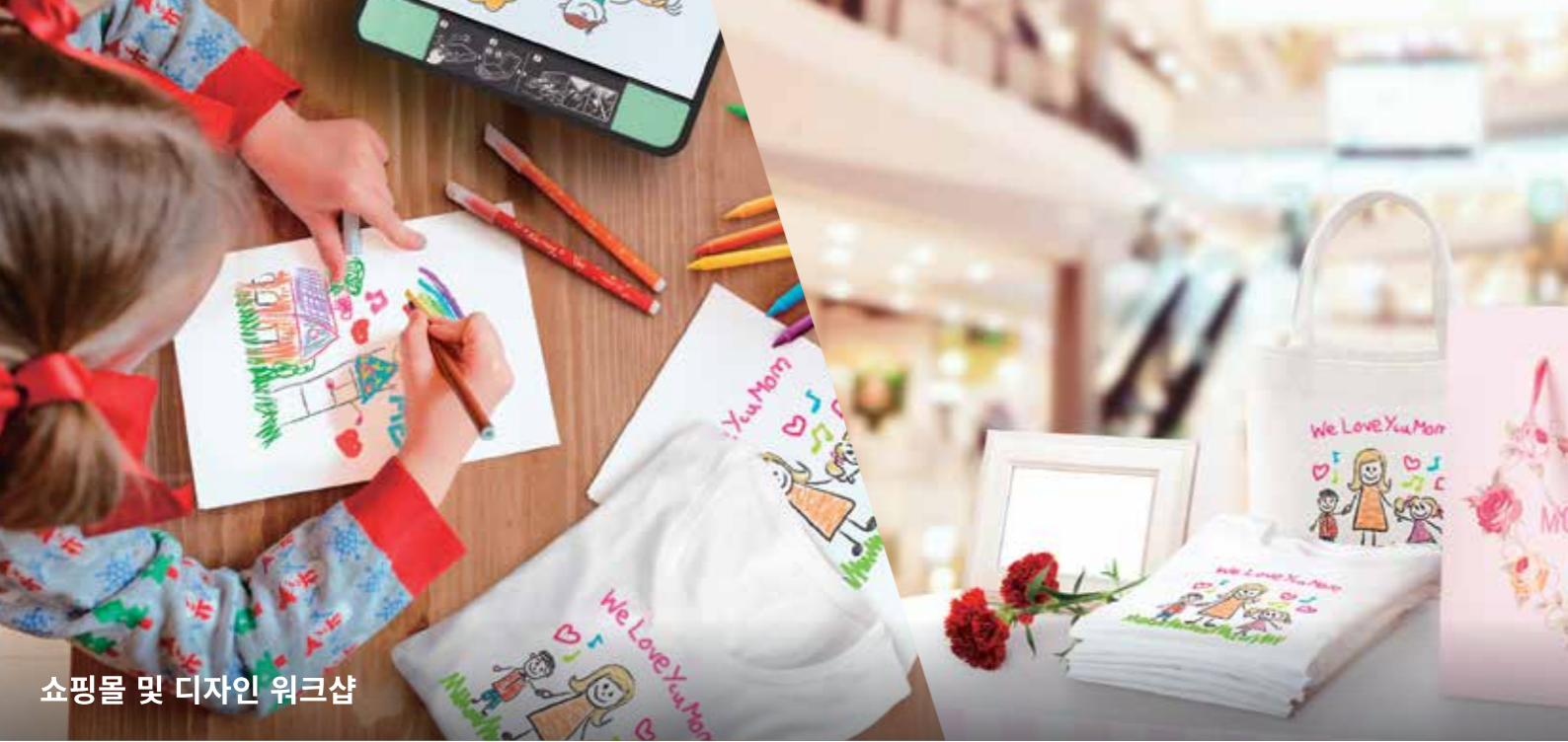
쇼핑몰 및 디자인 워크샵